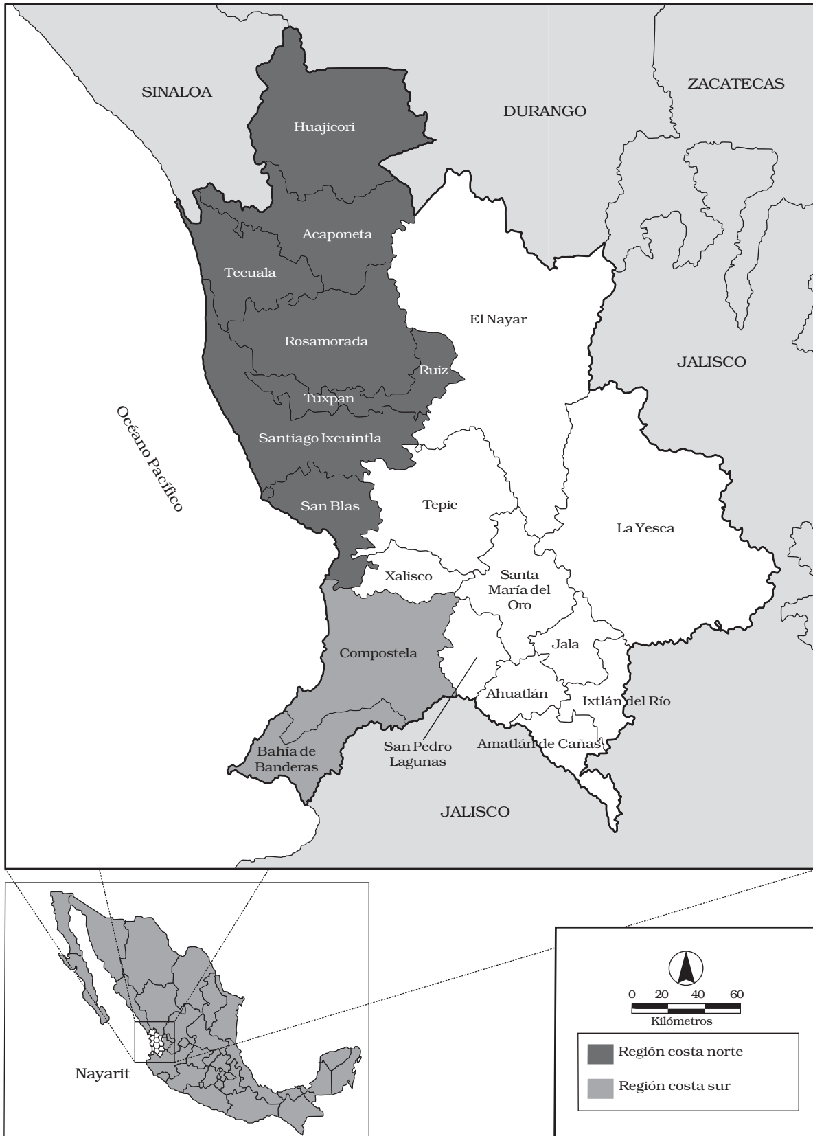
Mapa 1 Nayarit: municipios y regiones tabacaleras